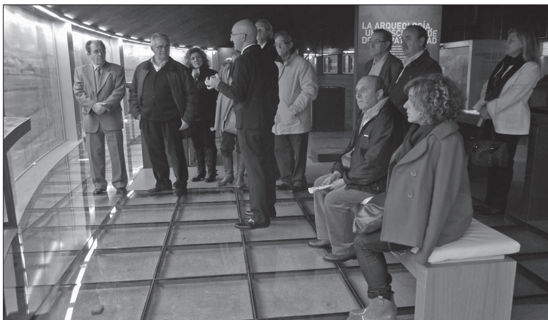
Grupo de asistentes durante la visita al CIYAB.

En junio de 2011 se firmó el convenio de colaboración con el Excmo. Ayuntamiento de Guadix para la edición del Boletín número 24, correspondiente al año 2011.