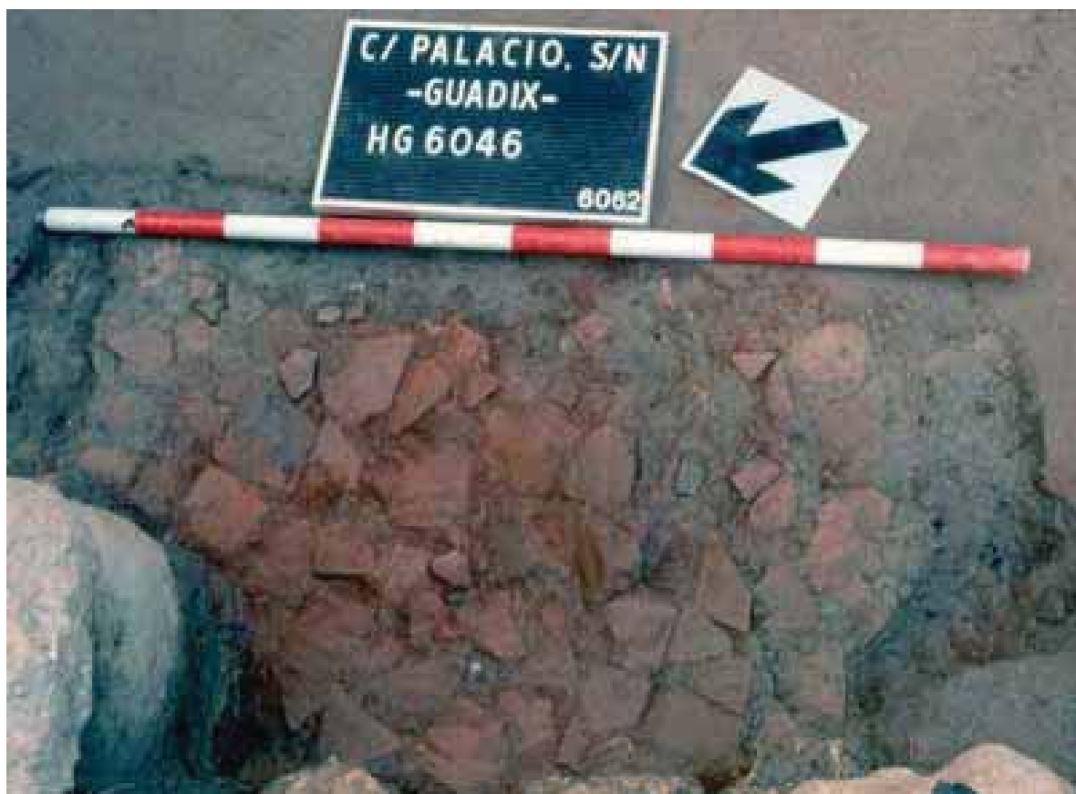
Lám. 13. Hogar doméstico del siglo VI a. C. en la calle Palacio (1997).

La secuencia estratigráfica presentó niveles de ocupación desde época moderna hasta niveles ibéricos, documentándose las siguientes fases de la cultura ibérica: Protoibérico-Ibérico Antiguo, Ibérico Antiguo e Ibérico Pleno. Los vestigios arqueológicos adscritos a la fase Protoibérico-Ibérico Antiguo (600-550 a. C.) fueron los restos de un suelo asociado a una habitación de 3 m 2 de extensión aproximadamente, y un conjunto cerámico de finales de los siglos VII y VI a. C. donde se identificaron por un lado, fragmentos de cerámica gris bruñida a torno (forma 1 de la tipología de Bellido), fragmentos de ánfora ibérica con desgrasantes gruesos (correspondientes a la familia de la R-1) y también cerámica a mano residual (procedente en su mayoría del Bronce Final, que se intuían por debajo sin poder ser excavados por alcanzar el nivel freático); además, se encontró un soporte carrete pequeño con cronología de entre los siglos VII y VI a. C., una olla de borde almendrado en cerámica tosca del siglo VI a. C. y un fragmento de urna policromada.