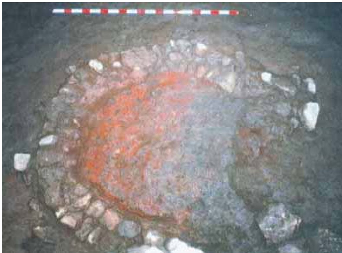
Lám. 14. Horno de pan en el Cine Acci (1998).

De época ibérica fueron identificadas cinco fases. En primer lugar en la fase I se encontraron restos de un hogar de pizarra (sondeo 1), un suelo de barro apisonado (sondeo 2) y restos de otros hogares (sondeo 4). En la fase II, se registraron una serie de muros de adobe a los que se les asociaron restos de suelos apisonados, así como también restos de material cerámico realizados a mano y a torno. De la fase III se conservaron muros de adobe con un zócalo de piedras de pequeño tamaño y en el suelo de arcilla asociado se localizaron al menos dos hogares y restos cerámicos realizados principalmente a torno. Ya en la fase IV, se identificaron una serie de estructuras con un horno relacionado éste con un conjunto de cerámicas realizadas a torno. Y finalmente en la fase V, se conservaron dos muros construidos con grandes piedras, posiblemente sillares, asociados a restos de suelo de tierra apisonada.