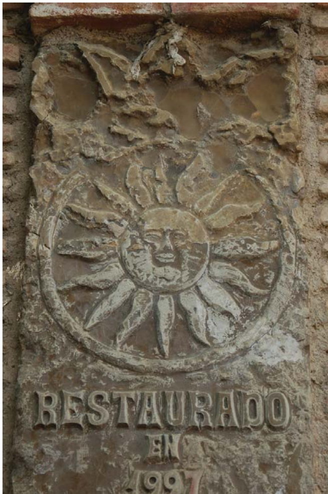
Lám. 1. Relieve del sol del caño de San Antón, considerado en el pasado de origen fenicio.

En cambio, los testimonios de Macrobio nos informan ya de aspectos sociales y religiosos de la población ibérica (Macrobio, 2009: 1. 5). Los accitanos veneraban al dios Marte, adornada su imagen con rayos de sol, a quien llamaban Netón. Se trata de una advocación que pervive desde época prerromana, pero de la cual tenemos constancia en algún epígrafe sobre el cual volveremos más tarde. No habría que olvidar,