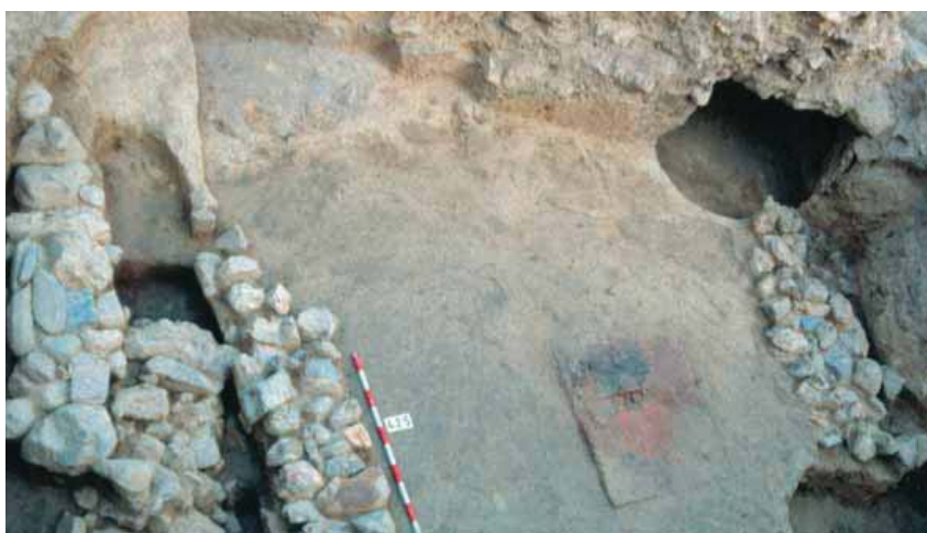
Lám. 8. Fondo de cabaña del Bronce Pleno, en la calle de San Miguel (1991).