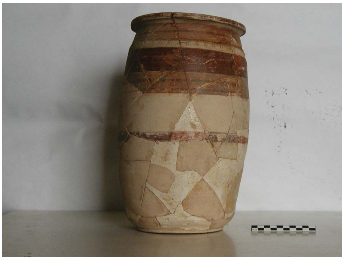
Lám. 16. Cerámica ibérica con decoración pintada y estampillada.

No se han encontrado aún restos de la muralla ibérica, pero se piensa que su trazado no pudo ser muy diferente al de la muralla medieval, que a su vez sigue la romana, y con cuyos materiales está construida en muchos de sus tramos, como las torres de la calle de San Miguel, donde se observan sillares de biocalcarenitas incrustados en la argamasa.