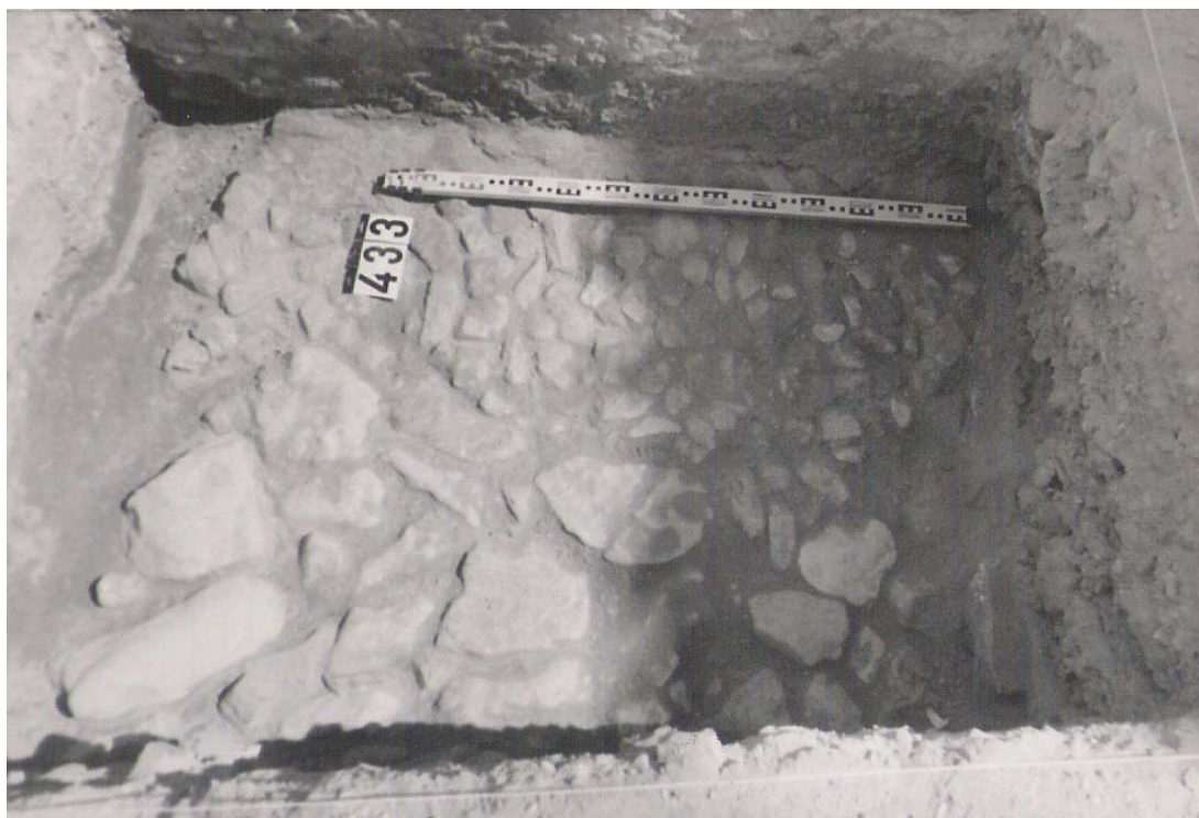
Lám. 9. Superposición de muros ibéricos y romanos en la calle Concepción (1993).