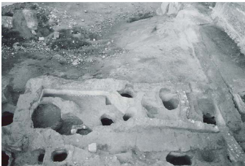
Lám. 7. Estructura de un posible templo romano perforado por diversos fosos y pozos medievales y modernos, de la calle de San Miguel (1991).