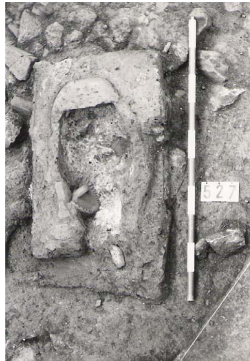
Lám. 12. Tannür u horno medieval en el Hospital Real.

La siguiente fase pertenecía a los siglos I-II d. C., y se relacionaban con la existencia de una gran canalización que corría en sentido norte-sur, realizada en opus caementicium , y con el interior de sección rectangular con cubierta a dos aguas, mientras que el exterior presentaba una caja de sección rectangular