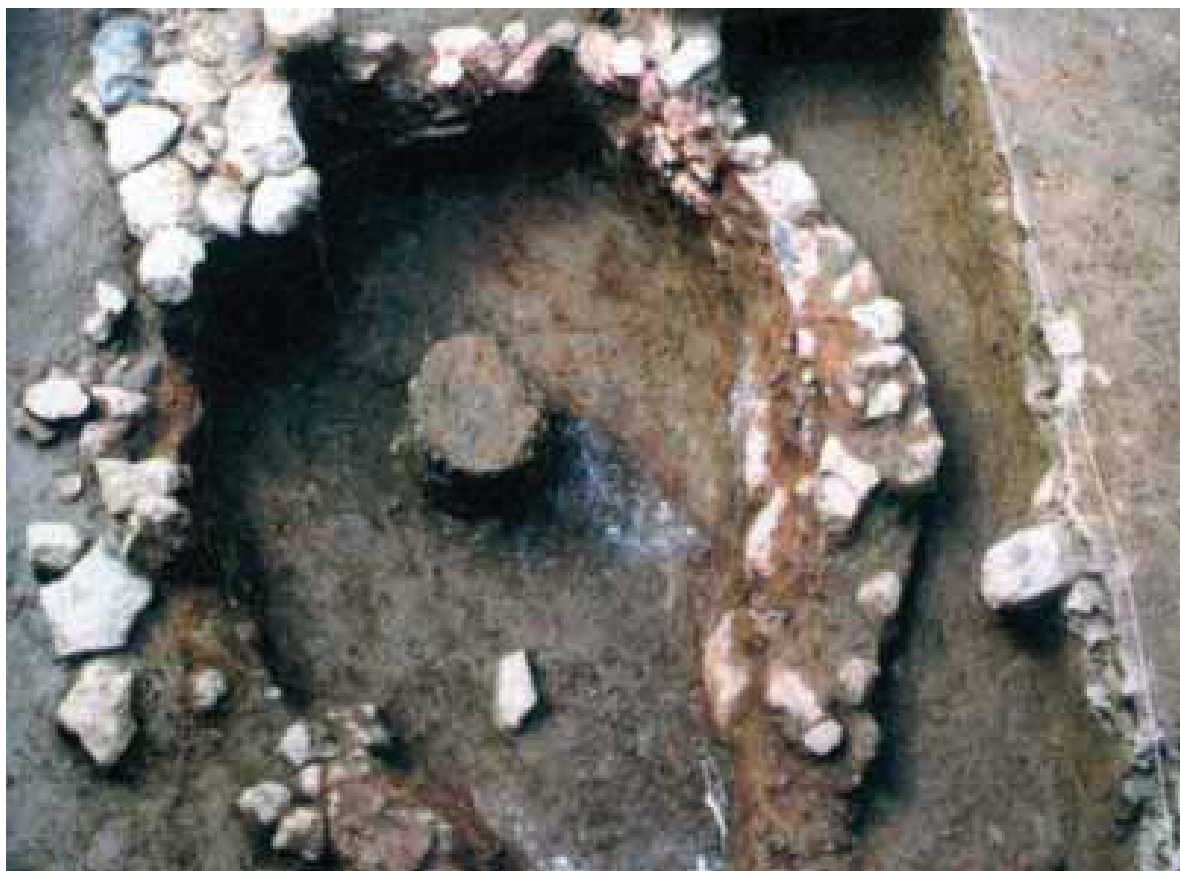
Lám. 15. Horno ibérico de cerámica en la calle Tahona (2001).

En la secuencia estratigráfica se documentaron niveles de ocupación de época de la Edad del Bronce, ibérica, romana, medieval y finalmente, moderna. Por