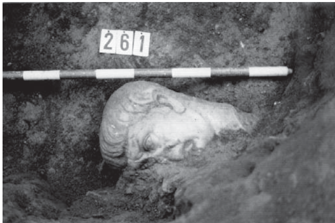
Lám. 2. Busto del emperador Trajano aparecido en la excavación de la calle de San Miguel en 1991.