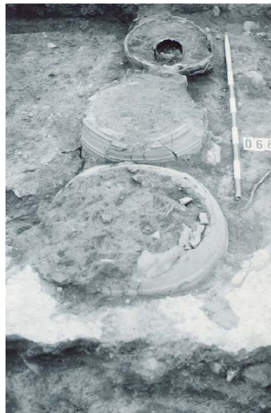
Láms. 4 y 5. Tinaja medieval y tinajero califal aparecidos en la calle de San Miguel (1991).