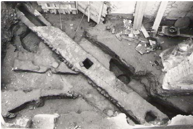
Lám. 11. Canalización romana subterránea en el Hospital Real (1994).

Esta excavación se realizó en la zona central del patio del antiguo Hospital Real de Guadix, y se documentaron fundamentalmente dos fases constructivas. La más reciente corresponde a niveles altomedievales, posiblemente de los siglos XI-XII, del que se destaca la presencia de una tannür con la boca cubierta por una tapadera de cerámica bizcochada, siendo correspondientemente extraída para su conservación.