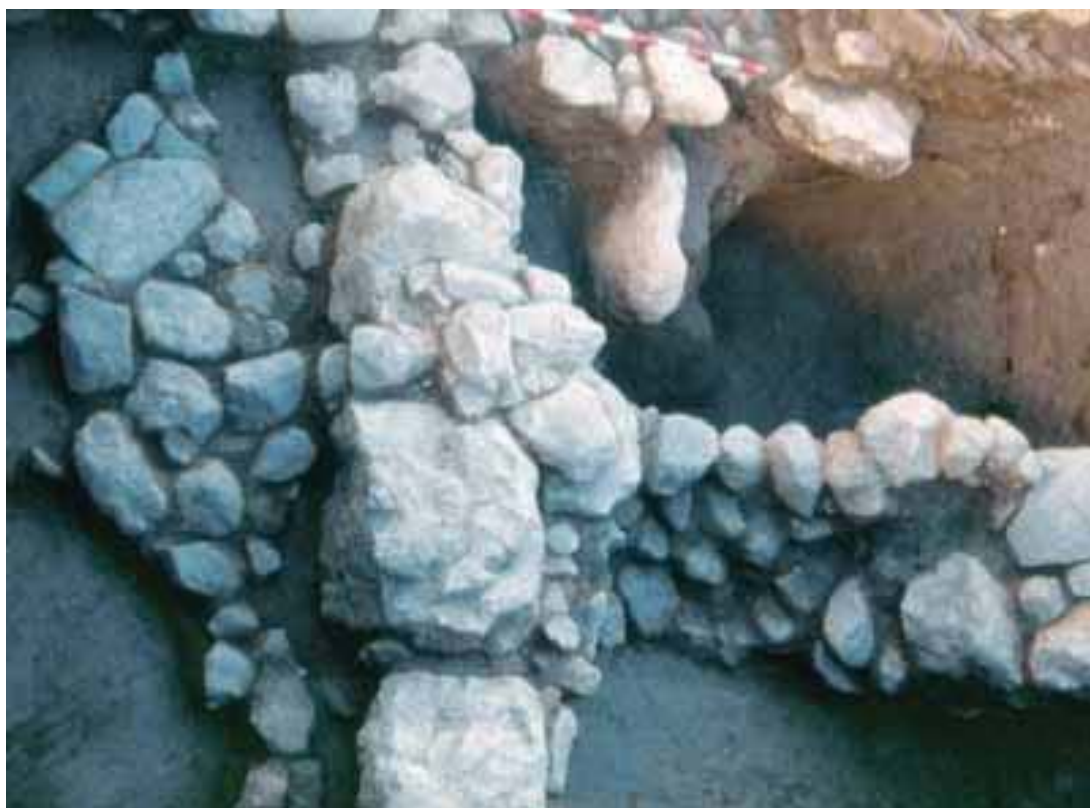
Lám. 10. Empedrado romano de una calle, en la excavación en la calle Concepción (1993).