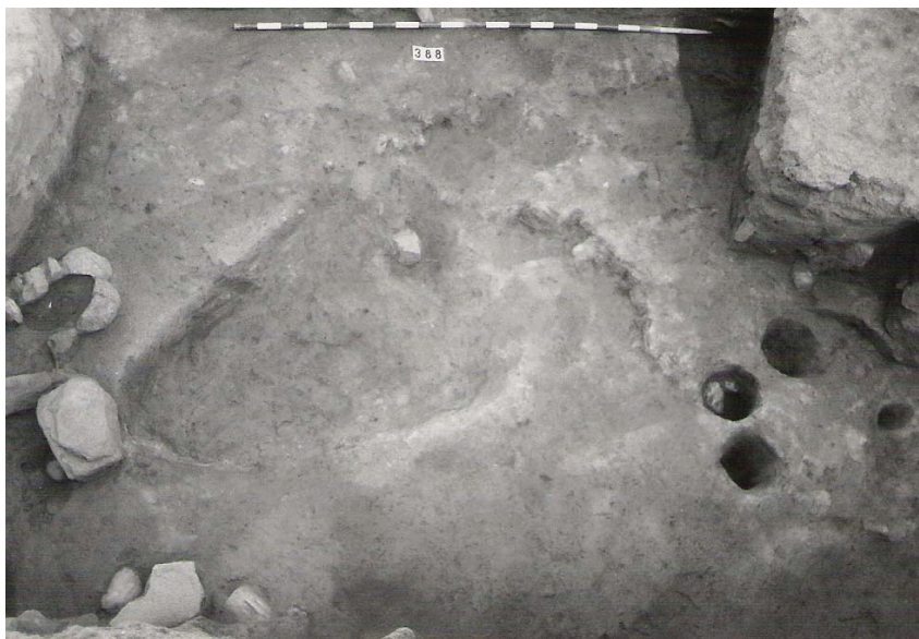
Lám. 6. Fondo de cabaña con agujeros de postes para soporte de las techumbres, del Bronce Final, de la calle de San Miguel (1991).