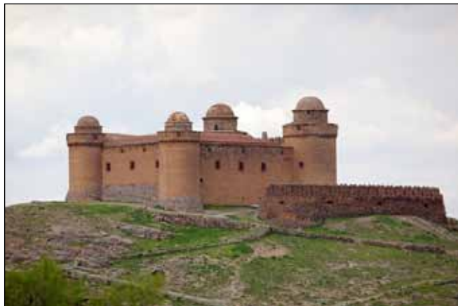
Exterior del castillo-palacio de La Calahorra.

Italia un flete que desembarca en Cartagena y que podría destinarse a La Calahorra, aunque esto no está documentado.