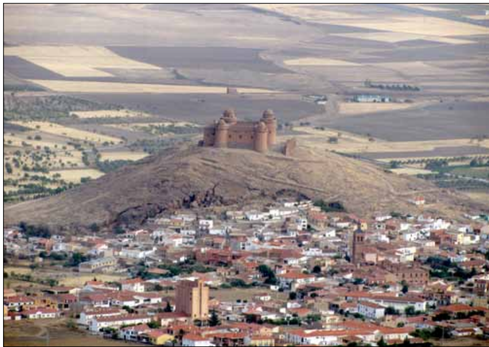
Vista panorámica del castillo y villa de La Calahorra.