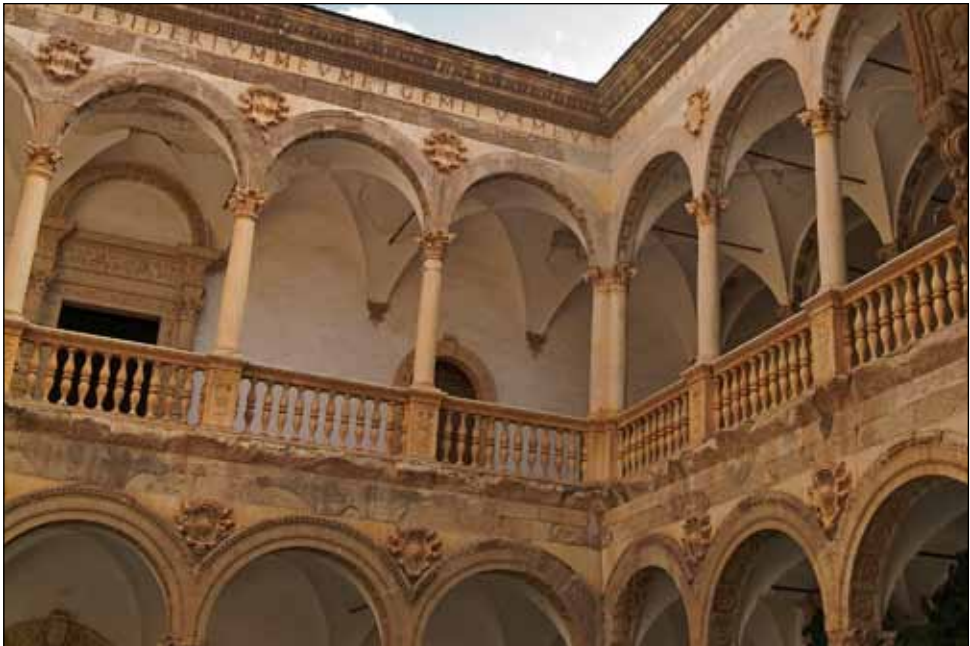
Patio de honor del castillo-palacio de La Calahorra.