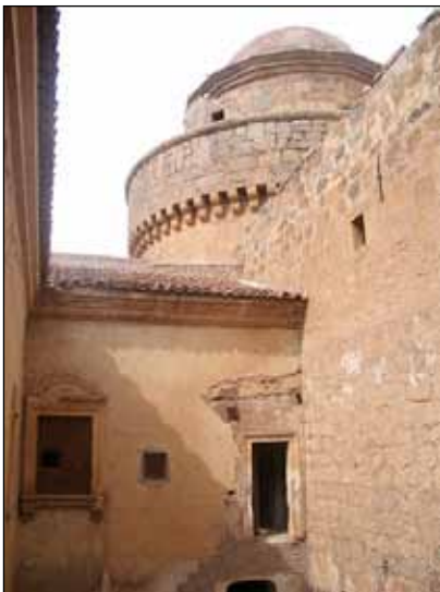
Patio de las Damas del castillo-palacio de La Calahorra.

De las cuentas de los mayordomos se puede extraer el personal que se instaló en el castillo. Los marqueses tenían “cámaras” diferentes, término que hace referencia a sus aposentos privados y al personal que los servía. La marquesa contaba con ocho damas y un portero de cámara que, naturalmente, era un varón. En cuanto al marqués, tenía tres pajes que trajo de Jaén y un portero; y cuando salía del castillo siempre le acompañaban siete continios o soldados de gran confianza, que al mando de un capitán formaban su guardia pretoriana. Algunos de ellos eran jinetes especializados en montar a la estradiota 20 y ganaban 25.000 maravedíes anuales, siendo los mejor pagados de toda la fuerza de guerra.