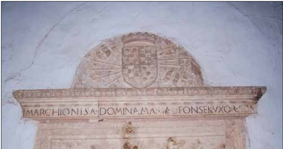
Puerta de acceso a las dependencias de la marquesa.

El entretenimiento principal de la marquesa y sus damas era el taller de hilado y costura. Esta costumbre era de larga tradición en las cortes feudales, en donde se tejían valiosos tapices y toda la indumentaria del personal del castillo. En La Calahorra este hecho se documenta por la gran adquisición que se hizo de tejidos